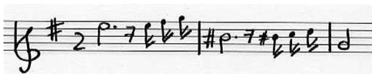
Exemple 2 : Prélude du monologue d'Armide, Armide , acte II, scène 5, p. 99.

Ils sont nommés par Herbert Schneider « motifs des démons 34 » et sont le plus souvent fondés sur des rythmes pointés, à l'allure tourmentée et nerveuse. On en trouve un exemple caractéristique dans le prélude du monologue d'Armide au deuxième acte, à la partie de dessus de violons (exemple 2). (note à supprimer).